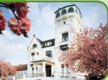
Jachtslot de Mookerheide