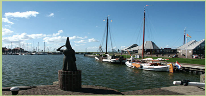
Vrouwtje van Stavoren