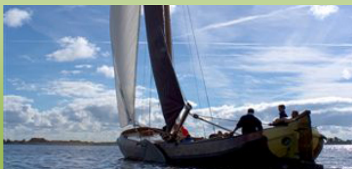
Skûtsje op 'Fluessen' meer

11 Galamadammen - Galamadammen is de naam van het 469 meter lange aquaduct dat is gebouwd op de kruising van de N359 en het Johan Friskanaal. Met de bouw werd begonnen in december 2005 en op 7 november 2007 werd hij opengesteld voor verkeer.