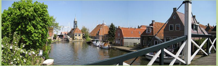
De Zijlroede in Hindeloopen