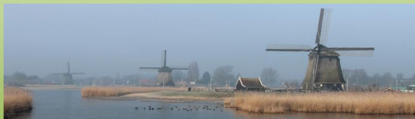
De strijkmolens D, C en B