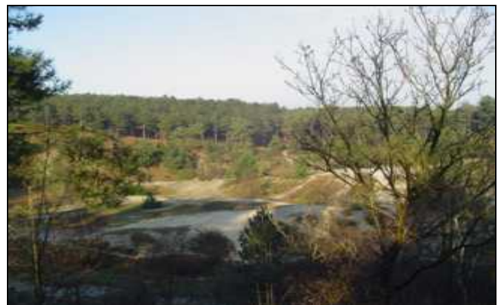
De Schoorlse duinen