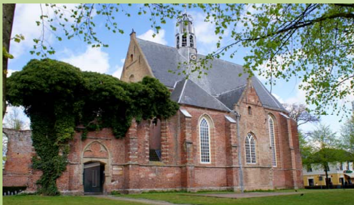
De Ruinekerk in Bergen

7 Bergen- Vanaf ongeveer 1900 staat Bergen bekend als een kunstenaarsdorp dat veel schilders, schrijvers en architecten aantrekt. In Bergen bepalen kunst, cultuur en cultuurhistorie dan ook de sfeer van dit dorp. Tussen 1915 en 1925 vormde zich in Bergen een bekende stroming in de Nederlandse schilderkunst genaamd De Bergense School. Deze kunststroming wordt gekenmerkt door een expressionistische stijl met kubistische invloeden en donkere tinten. Het Museum Kranenburgh in Bergen bevat een verzameling kunstwerken van deze Bergense School waarvan met name Charley Toorop en John Rädecker behoren tot de meest aansprekende en consequente kunstenaars van deze groep. De opvallende ruinekerk in het centrum van het dorp werd tijdens de Tachtigjarige Oorlog geplunderd en afgebrand door de Geuzen. In de periode daarna werd de geruïneerde kerk deels herbouwd en in gebruik genomen als protestantse kerk. Tijdens de Slag bij Bergen in 1799 werd er vervolgens rond de kerk zwaar gevochten toen Engelse en Russische soldaten het toenmalige Frans-Bataafse Bergen aanvielen. De vele kogelgaten in de kerk herinneren nog aan deze tijd.