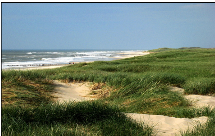
Strand bij Bergen aan zee