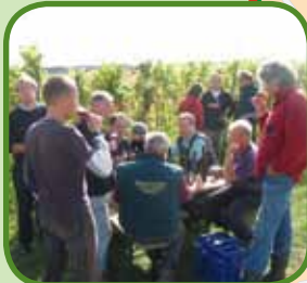
Proeverij bij Wijnhoeve De Colonjes