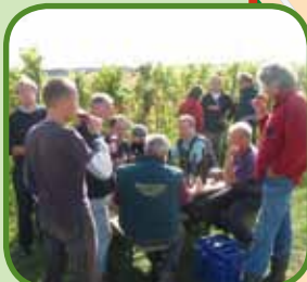
Proeverij bij Wijnhoeve De Colonjes