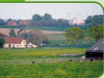
Het Groesbeekse landschap

In april 2006 is Wijngaard De Plack aangelegd in het Groesbeekse kerkdorpje De Horst, aan de voet van het uitgestrekte Reichswald. Deze biologische wijngaard is 1 hectare groot. Proeflokaal dagelijks geopend van 10:00-17:00 om te proeven en kopen. Rondleiding/proeverij op afspraak.