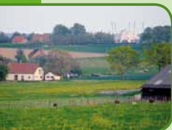
Het Groesbeekse landschap

Wijnhoeve De Heikant is gelegen aan het draisine-traject Groesbeek-Kranenburg-Kleef. In september 2009 wordt hier het nieuwe Wijnchateau geopend, waar men onder meer kan proeven van wijn van De Heikant en kan uitkijken over de wijngaard. Elke laatste woensdag van de maand, gedurende de bouw van het Wijnchateau, krijgt u de gelegenheid de vorderingen te aanschouwen en kunt u een rondleiding krijgen.