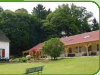
Vakantieboerderij en Wijngaard De Holdeurn

Wijngaard De Plack, Ketelstraat 36 Groesbeek, T. 024-3978358, www.wijngaarddeplack.nl , nabij 78