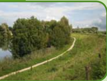
De dijk naar Oud-Zevenaar