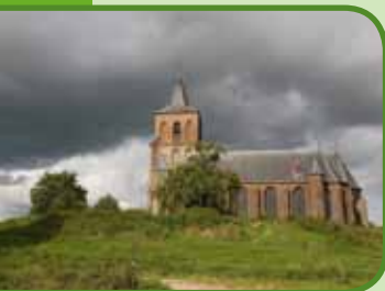
De kerk bij Oud-Zevenaar