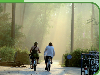
Het Nationale Park De Hoge Veluwe

Stap een dagje in het leven van uw vader, grootvader en overgrootvader. Geniet van het prachtige museumpark vol herinneringen die u graag wilt delen. Bewonder de verzameling van ruim tachtig originele huizen, boerderijen en molens. Op heel veel plekken ontmoet u ook de 'bewoners' en is er van alles te doen voor jong en oud. Een bezoek aan het Openluchtmuseum is dan ook het leukste dagje uit voor de hele familie. Kijk voor openingstijden en toegangsprijzen op de website.