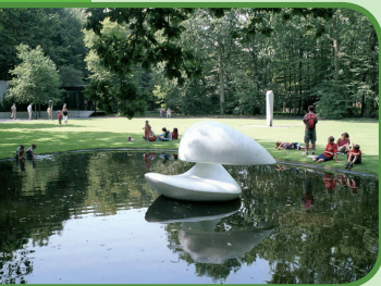
Beeldentuin Kröller-Müller Museum

Het Nationale Park De Hoge Veluwe, www.hogeveluwe.nl , ten noorden van 4, 5, en 70