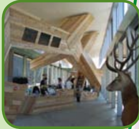
Veluwetransferium De Posbank