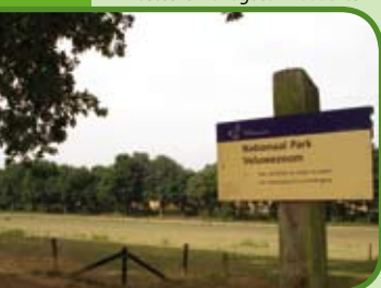
Nationaal Park Veluwezoom

lekkere wijnen, jams, geleien en natuurlijk druivenplanten voor uw eigen achtertuin. Rondleidingen op afspraak.