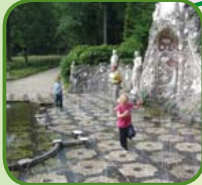
De Bedriegertjes in Park Rosendaal