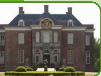
Kasteel en landgoed Middachten

Bezoek de grootste ommuurde biologische wijngaard van Nederland! Twee hectare met veertien verschillende soorten resistente druivenrassen op het historisch landgoed Hof te Dieren. Tevens het adres voor