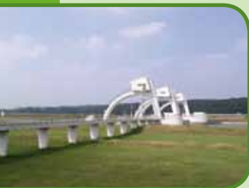
Sluizencomplex te Driel

Maak kennis met het alledaagse leven van 'toen' en haal uw hart op bij het aanschouwen van zoveel prachtige voorwerpen welke zonder meer een nostalgische gedachte bij u los zullen maken. Ook voor kinderen een geweldige ervaring. In 2009 is de museumboerderij geopend op Paaszaterdag en van 11 apr. t/m 26 sept. Alle zaterdagen van 10.30 tot 16.00 uur. Tevens elke woensdagmorgen van 09.30 tot 12.00 uur en in de schoolvakanties ook de woensdagmiddag van 13.00 tot 16.00 uur.