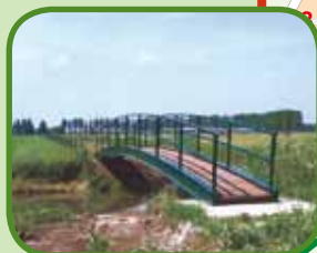
Bruggetje over De Linge

○ Knooppunt route Rondje Overbetuwe — Route Rondje Overbetuwe ○ Overige knooppunten — Overige verbindingen tussen knooppunten Lengte: +/- 50 km