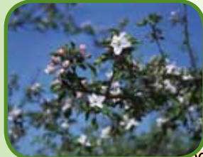
Bloesem in één van de vele boomgaarden