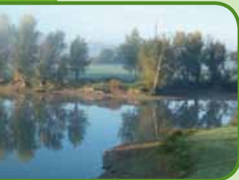
Uitloper van de Waal

Florence Nightingale Instituut, Stationsstraat 27 Zetten, T. 0488-473390, www.fni.nl , nabij 54