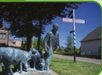
Kunst en cultuur in De Liemers