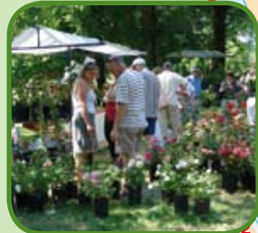
Internationale Kwekerijdagen Huis Bingerden

Heeft u op- of aanmerkingen over de bewegwijzering, de route of de bijbehorende fietsroutekaart, dan kunt u contact opnemen met het routebureau van het Regionaal Bureau voor Toerisme KAN via www.lekkerfietsen.nl en T. 0900-6070803 (15 cpm).