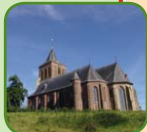
Martinuskerk in Oud-Zevenaar

○ Knooppunt route Rondje Liemers — Route Rondje Liemers ○ Overige knooppunten — Overige verbindingen Lengte: +/- 47 km