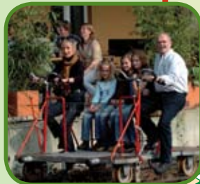
Fietsdraisine tussen Groesbeek en Kleef

Heeft u op- of aanmerkingen over de bewegwijzering, de route of de bijbehorende fietsroutekaart, dan kunt u contact opnemen met het routebureau van het Regionaal Bureau voor Toerisme KAN via www.lekkerfietsen.nl en T. 0900-6070803 (15 cpm).