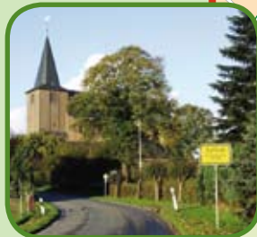
De kerk in Zylfflich