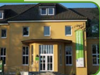
Bezoekerscentrum in Kranenburg

Niets uit deze folder mag worden overgenomen, op welke wijze dan ook, zonder voorafgaande schriftelijke toestemming van de copyrighthouder / uitgever.