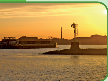
De splitsing van Rijn en Waal

Ten zuiden van knooppunt 80 bevindt zich het gebied De Klompewaard. Dit natuurgebied is ongeveer 120 hectare groot en de landtong in dit gebied splitst als het ware de Rijn (in het Panterdensch Kanaal) en de Waal. De natuur in dit gebied ontwikkeld zichzelf, waardoor dit een paradijs is geworden veel verschillende dieren en planten. Bijzonder is Fort Panterden, een haast onneembaar vestigingswerk bij de splitsing van de rivieren.