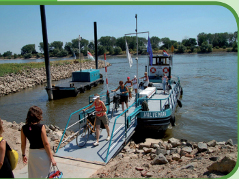
Per pontje de rivier over