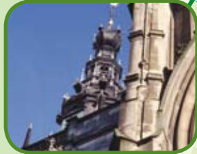
De St. Stevenstoren