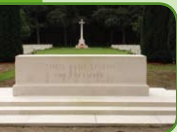
Nijmegen, Begraafplaats Jonkerbos

Het Maldens Vlak, in het zuidelijke gedeelte van Heumensoord, bestaat voor het grootste gedeelte uit bos. Dit is een heerlijke plek om even van uw fiets te stappen en te kijken naar de vele zweefvliegtuigen van de Nijmeegse Aeroclub. In een kruis liggen twee banen midden in het bos.