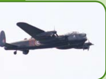
De Lancaster was wellicht de beste bommenwerper uit de Tweede Wereldoorlog