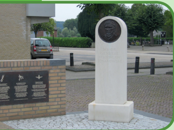
Monument ter herinnering aan Generaal Sosabowski (Driel)