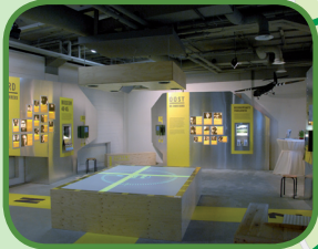
Informatiecentrum 'Slag om Arnhem'

Heeft u op- of aanmerkingen over de bewegwijzering, de route of de bijbehorende fietsroutekaart, dan kunt u contact opnemen met het routebureau van het Regionaal Bureau voor Toerisme KAN via lekkerfietsen.nl en T. 0900-6070803 (15 cps).