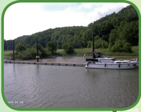
De stuwwal bij Renkum

○ Knooppunt Liberation Route — Liberation Route ○ Overige knooppunten — Overige verbindingen tussen knooppunten ★ Luisterplek Liberation Route Lengte: +/- 32 km