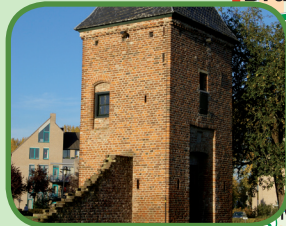
Torentje vml Kasteel Blankenburg

Heeft u op- of aanmerkingen over de bewegwijzering, de route of de bijbehorende fietsroutekaart, dan kunt u contact opnemen met het routebureau van het Regionaal Bureau voor Toerisme KAN via www.lekkerfietsen.nl en T. 0900-6070803 (15 cpm).